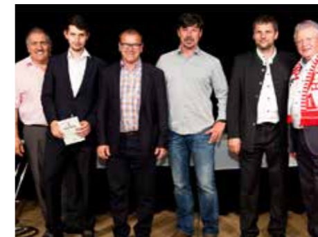
Die Trainer und Eltern der erfolgreichen Nachwuchs-Meistermannschaft ließen sich im Casino Linz feiern

Großartige Veranstaltung auch heuer wieder im Casino Linz. Nachdem wir in dieser Saison zwei Meistertitel zu feiern hatten, fuhr eine 13-köpfige Partie samstagsabends nach Linz. Da die 9er Mannschaft (Meister in der 2. Klasse)