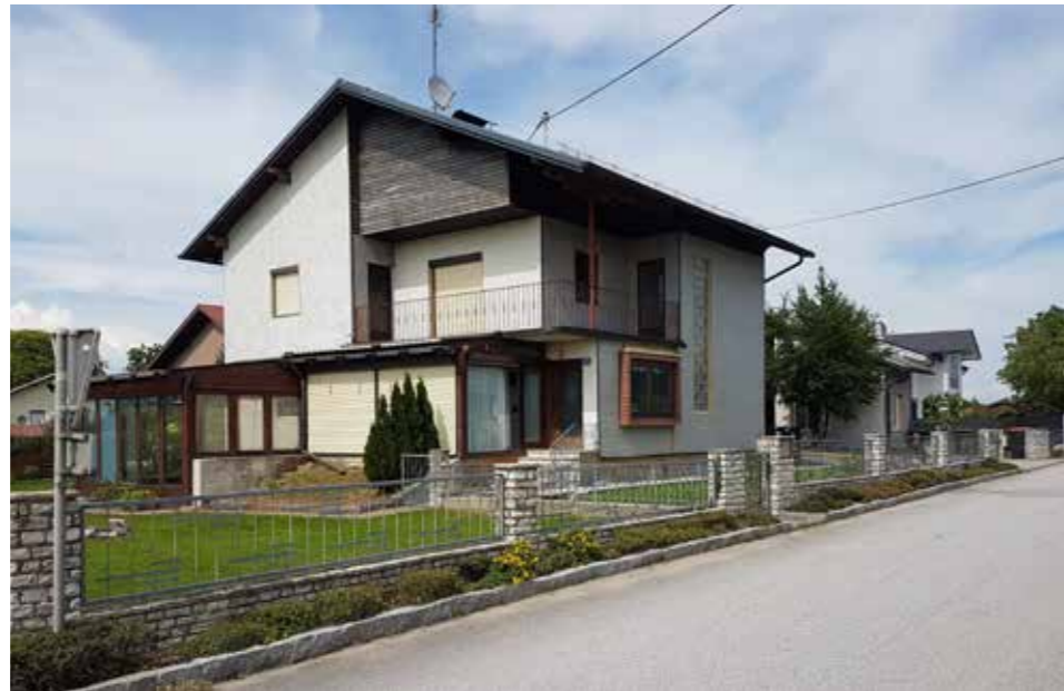
Das Caritas-Flüchtlingshaus wurde aufgelassen

Das macht einmal mehr der Fall der drei Somalierinnen deutlich, die drei Jahre in Ried waren und kurz nach dem Auszug aus dem Flüchtlingshaus nach Bulgarien abgeschoben wurden. Die beiden Töchter befanden sich sehr erfolgreich in Berufsausbildungen. Maryam besuchte die Schule für Sozialbetreuungsberufe in Steyr und hat im Altenheim in Ried Praktika ab-