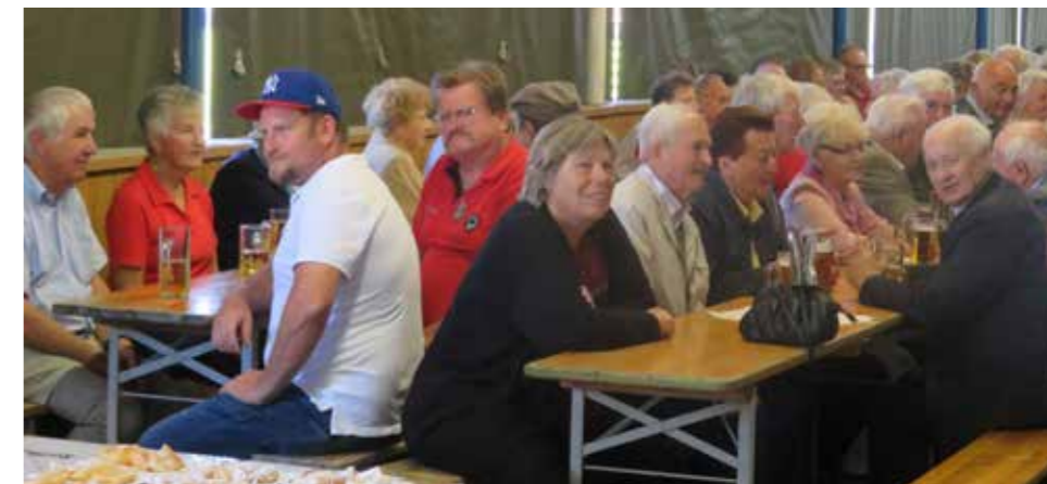
Besucher bei unserem Frühschoppen