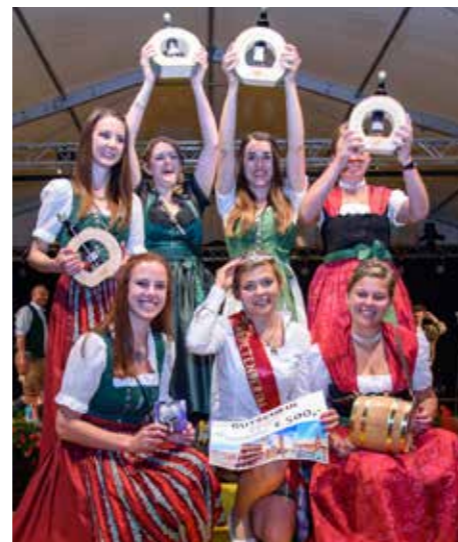
Die 7 Kandidatinnen für die Wahl zur „Miss Marketenderin“