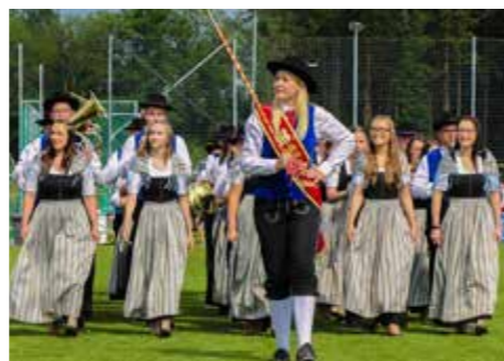
Bei der Bezirksmarschwertung in Ried/Tr.