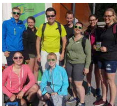
Beim Bergevent auf der Wurzeralm