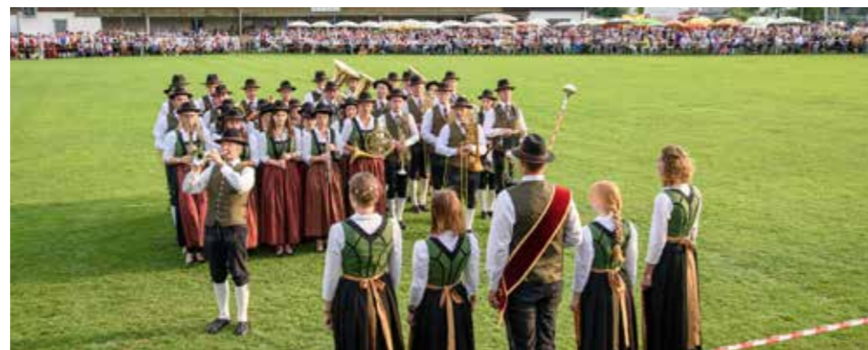
Der Musikverein Ried bei der Marschwertung. Zu sehen ist ein Ausschnitt aus dem Showprogramm.

Am 9. Juni trat der Musikverein Ried in Roitham im Bezirk Gmunden zur Marschwertung in der Stufe D an und erreichte einen „Ausgezeichneten Erfolg“ mit 94,47 Punkten. In der Stufe E (Höchststufe mit Showprogramm) konnte am 23. Juni beim Bezirksmusikfest in Sipbachzell mit 92,95 Punk-