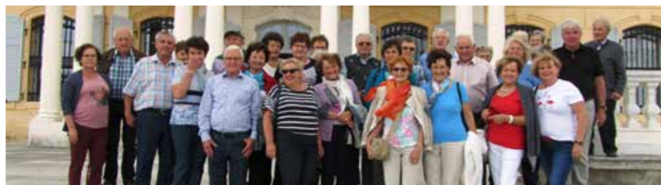
Eine wunderschöne Reise erlebten die Seniorenbundmitglieder