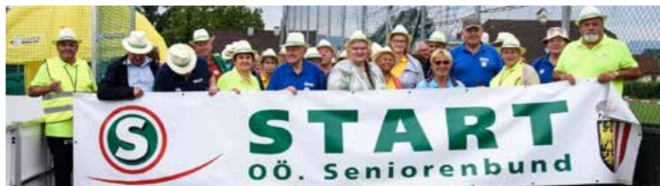
Auf los ging's los

Nach der Übernachtung in Stockerau erweiterten wir unsere Geschichtskennntnisse bei der Führung durch die Gedenkstätte von Feldmarschall Radetzky in Heldenberg. Am Heldenberg befindet sich auch das Ausbildungs- und Trainingszentrum sowie Sommerquartier für die Lipizzaner der Spanischen Hofreitschule. Es war schön,