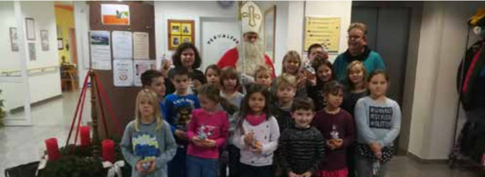
Besuch vom Nikolaus

Die Bewohner freuten sich sehr über den Besuch und die mitgebrachte Zeit. (Dagmar Prieler)