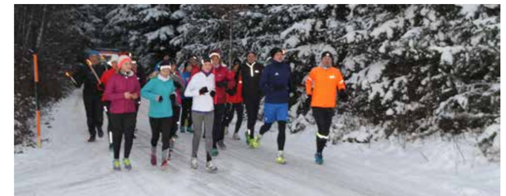
Die Läufer am Weg Richtung Ried

Alle Fotos finden Sie unter: www.riedtraunkreis.naturfreunde.at (Franz Bernegger)