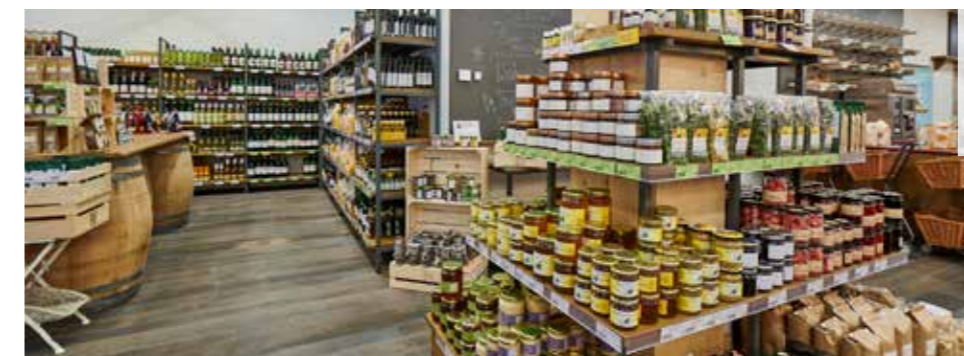
Der Hofladen von HOLZHAUS E1NS

Haben auch Sie etwas zu veröffentlichen? Melden Sie sich bitte unter Tel. 07588 / 72 55-11.