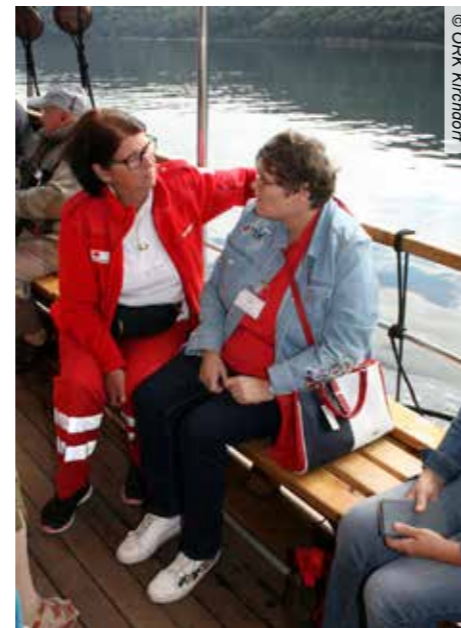
Bestens betreut werden die Teilnehmer bei den Reisen des Roten Kreuzes

Mehr Informationen über die Betreuten Reisen im Jahr 2019 erhalten Sie am Samstag, den 2. Februar 2019, ab 14 Uhr, bei unserem traditionellen Reise-caffe in der Bezirksstelle des Roten Kreuzes Kirchdorf. Anmeldung erbeten unter 07582/63581-24.