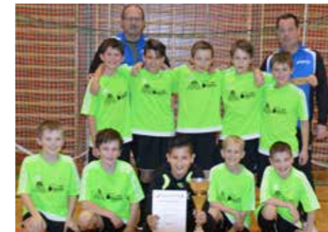
U12 – 1. Platz

Mit der U7, der U8, der U9 und der U10 sind wir bei den Jüngsten angetreten und konnten in der Finalrunde mit der U9 den hervorragenden 4. Platz erringen. In der Altersgruppe der U13 und U15 sind wir