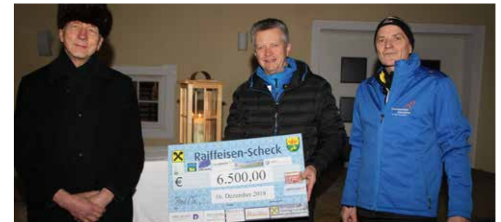
Eine sehr hohe Spendensumme konnte übergeben werden