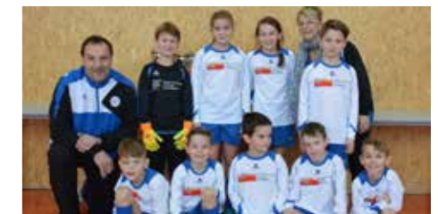
U9 – 4. Platz

Ein herzliches Dankeschön an die zahlreich mitgereisten Eltern, die unsere Teams immer stimmkräftig unterstützen! (Manfred Thaller)