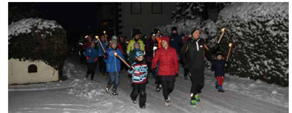
Die Kinder unterstützten die Läufer bei ihrem letzten Wegstück zum Pfarrheim