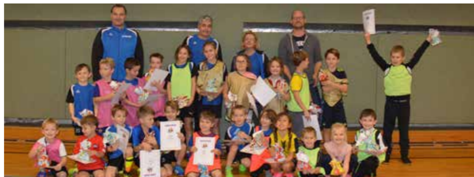
Mannschaften U7 - U9