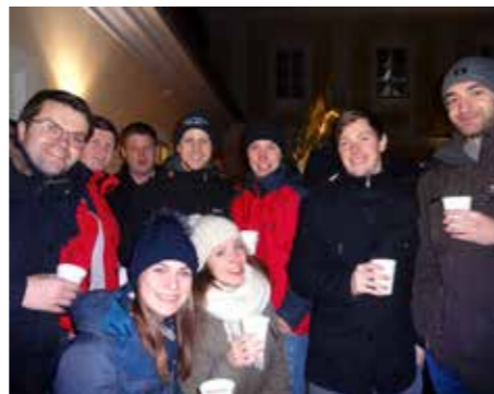
Der Punschstand nach der Mette ist ein beliebter Treffpunkt

Weihnachten ist ein Fest der Gemeinschaft. Auch heuer lud die Landjugend