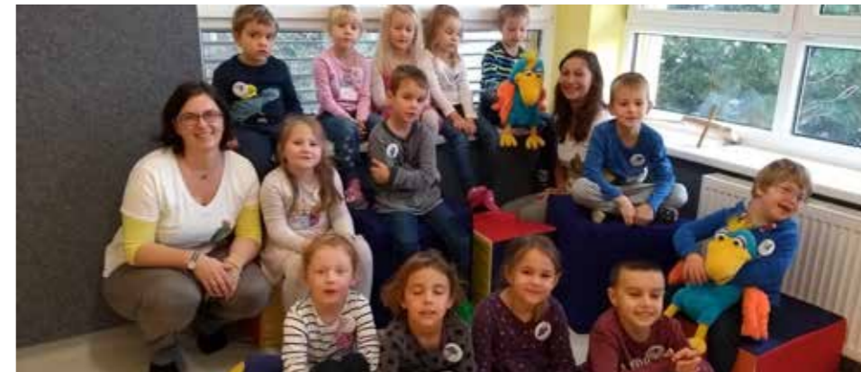
Mit dem Musikus zu Besuch im Kindergarten

Im November startete das Projekt Musikus im Kindergarten. Der Musikus zeigte den Kindern neben seinem Lieblingsinstrument der Blockflöte noch viele weitere Instrumente. Gemeinsam probierten wir verschiedene Instrumente aus, dirigierte ein Boomwhackerorchester (bunte Schlaginstrumente aus Kunststoff, die harmonisch aufeinander abgestimmt sind) und mussten erraten, wie welches Instrument klingt.