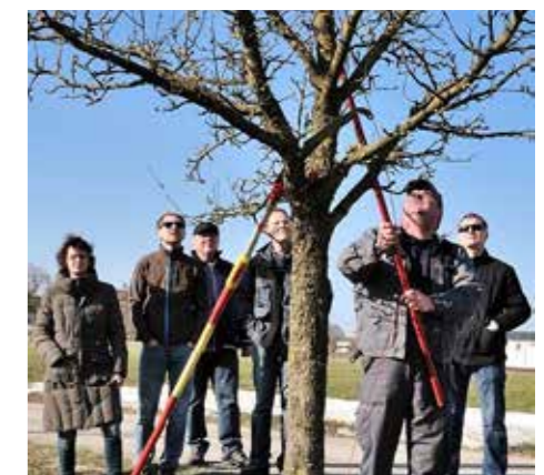
Der Fachmann gibt Tipps für den richtigen Baumschnitt

Von der Siedlergemeinschaft wird auch heuer ein Frühjahrs-Baumschnittkurs abgehalten, und zwar am Freitag, den 23. Februar (Ausweichtermin bei schlechtem Wetter wird noch bekannt gegeben). Zusammenkunft beim Haus der Siedlergemeinschaft, Beginn um 14:00 Uhr.