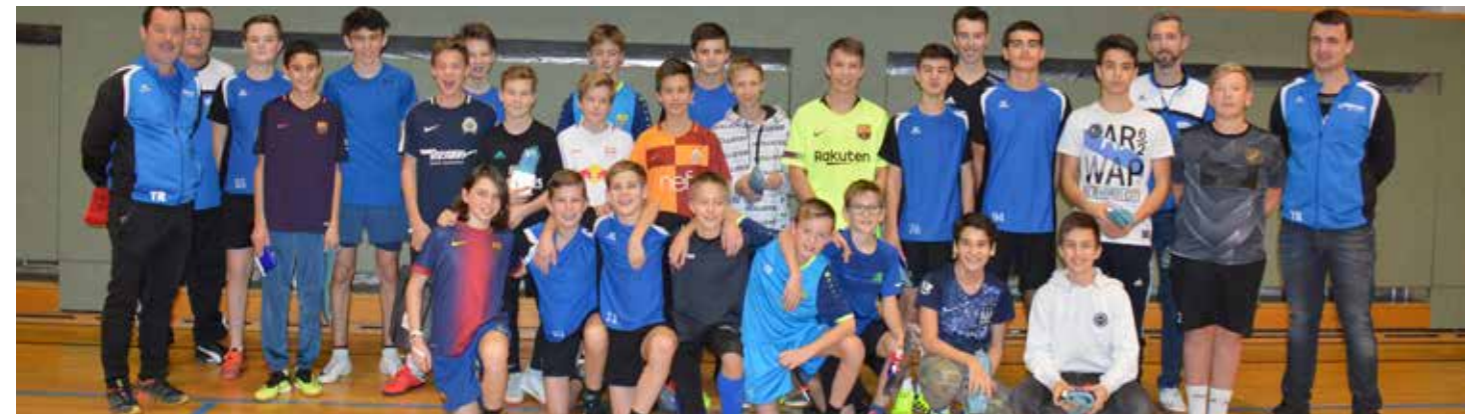
Mannschaften U14 und U15