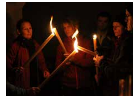
Im Stift Kremsmünster wurde das Friedenslicht entgegengenommen