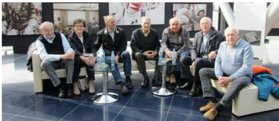
Auch von den Sitzplätzen hatte man einen schönen Blick auf die Flugzeuge