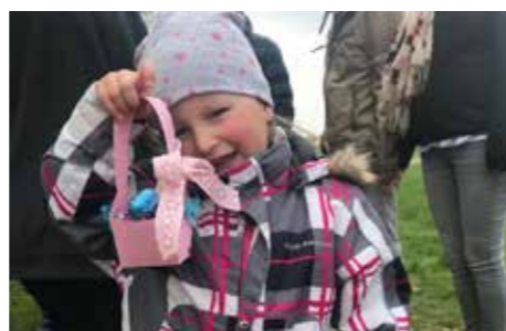
Ein Osternest gefüllt mit vielen Süßigkeiten