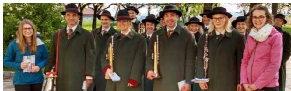
Danke für die freundliche Aufnahme beim Maiblasen