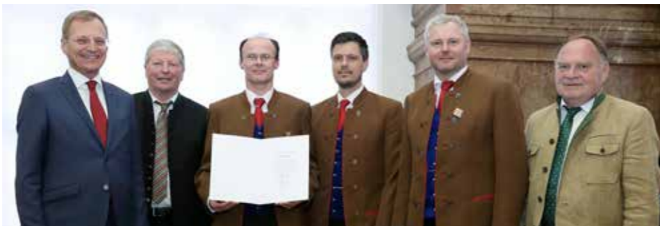
Dem Musikverein Voitsdorf wurde vom Landeshauptmann eine Ehrenurkunde überreicht