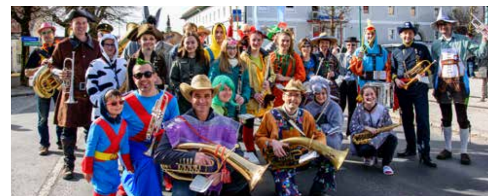
Auch die Musiker waren verkleidet