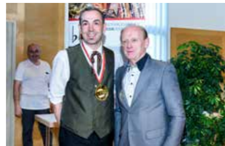
Gold für den Musikverein Ried

uns unfallfrei und sicher durch das Gemeindegebiet gefahren haben. Weiters bedanken wir uns bei allen, die uns bestens gepflegt haben! (Anna Strassmayr)