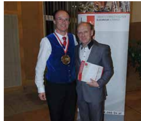
Die Musiker durften sich über den Bezirkssieg freuen