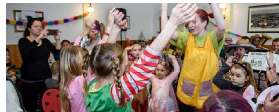
Es wurde viel getanzt, gesungen und gespielt