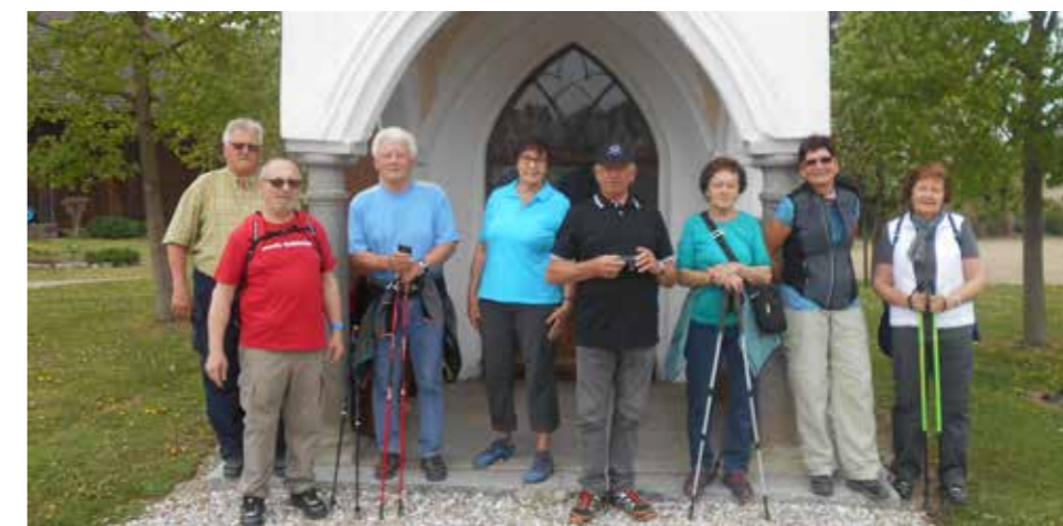
Kurzes Innehalten bei der Kapelle Fürneredt