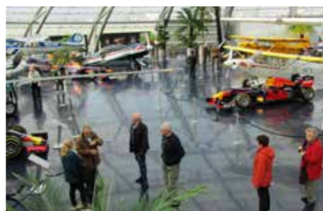
Manche erkundigten auf eigene Faust den Hangar 7