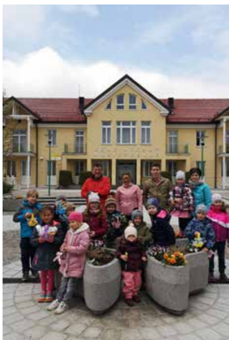
Start und Ziel waren beim Gemeindeplatz