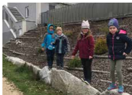
Kein Nesterl blieb unentdeckt