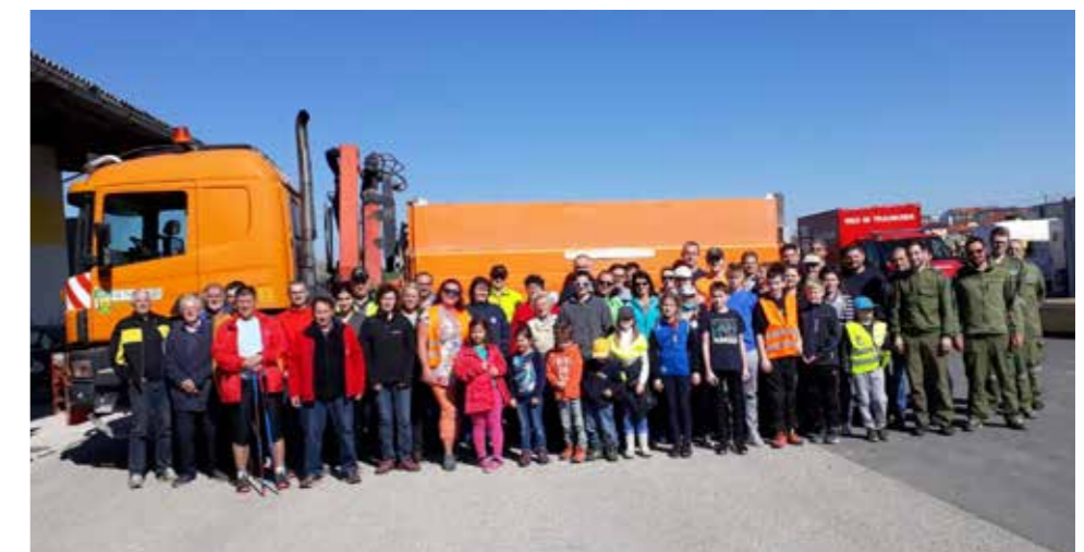
Danke an die zahlreichen Helfer und Sammler bei der Flurreinigungsaktion