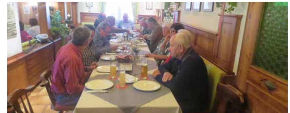
Ripperlessen in Spieldorf

Zum Mittagessen gab es vom Gasthaus Voralpenhof zubereitete Wiener Schnitzel, die allen sehr gut mundeten. Anschließend gab es noch Kaffee und von unseren Frauen gebackene Kekse. Mit einem gemütlichen Beisammensein klang die gelungene Weihnachtsfeier aus.