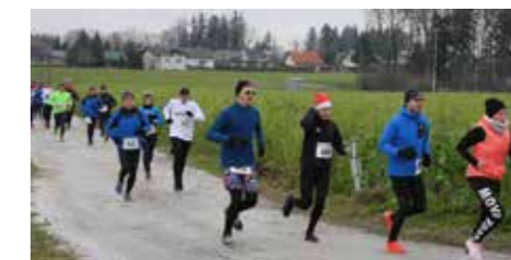
Auch ohne Zeitnehmung wollten viele Läufer ihre Bestzeit erreichen