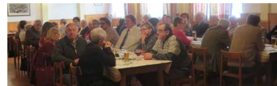
Weihnachtsfeier im ehem. Gasthaus Langeder