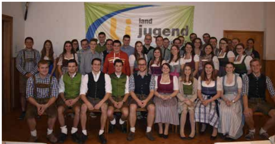
Die Mitglieder der Landjugend bei der Jahreshauptversammlung