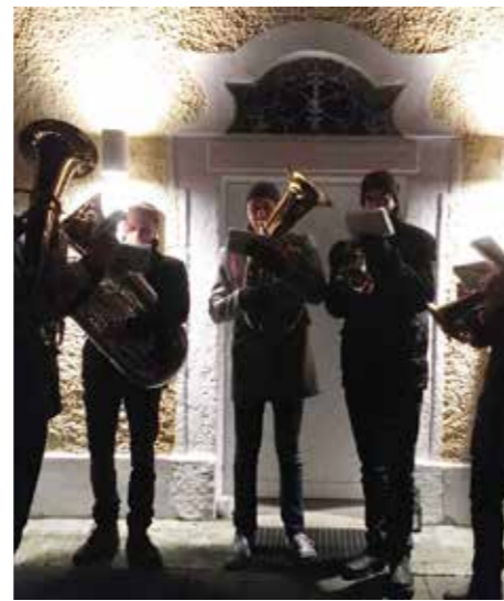
Die Musiker schafften durch ihr Spielen eine gemütliche Atmosphäre