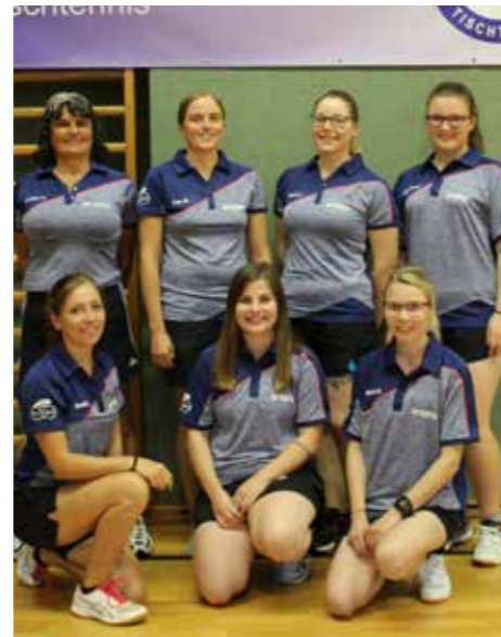
Die Damen krönten sich zum Herbstmeister