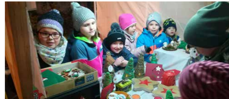
Beim Adventmarkt am Dorfplatz waren wir mit einem eigenen Stand vertreten