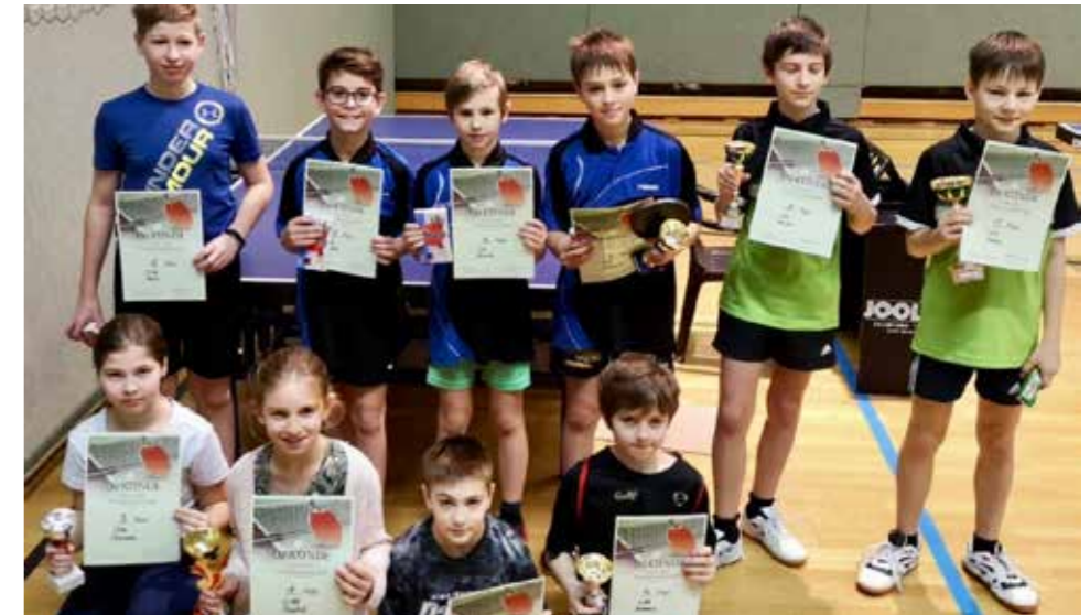
Die Next Generation präsentiert ihre Turnierausbeute