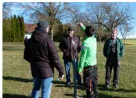
Besuchen Sie unseren Baumschnittkurs

Konnten wir Dein Interesse bzw. Deine Lust aufs Garteln am Windischbauer.