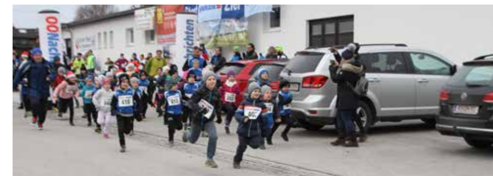
Die Kinder legten gleich einen rasanten Start hin