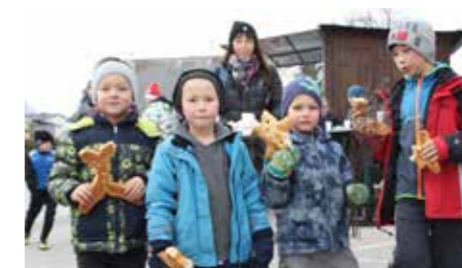
Die Brioche-Krampuse wurden gleich verkostet