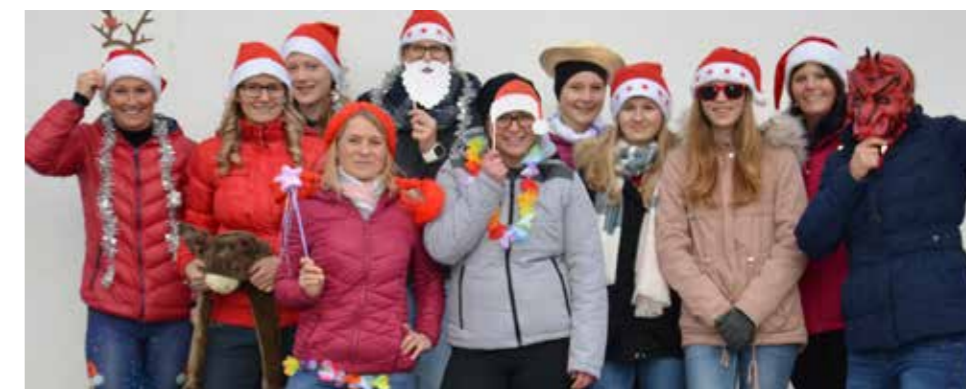
Die Ried4Speed-Gruppe nahm verkleidet am Lauf teil