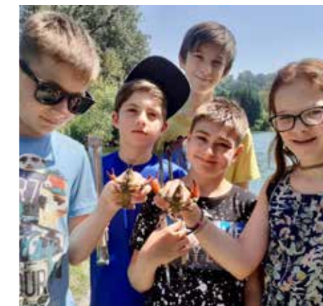
Krebsfische beim Saisonabschluss