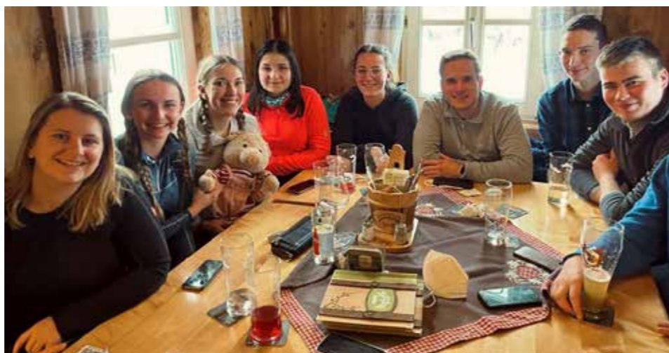
Skitag in Schladming