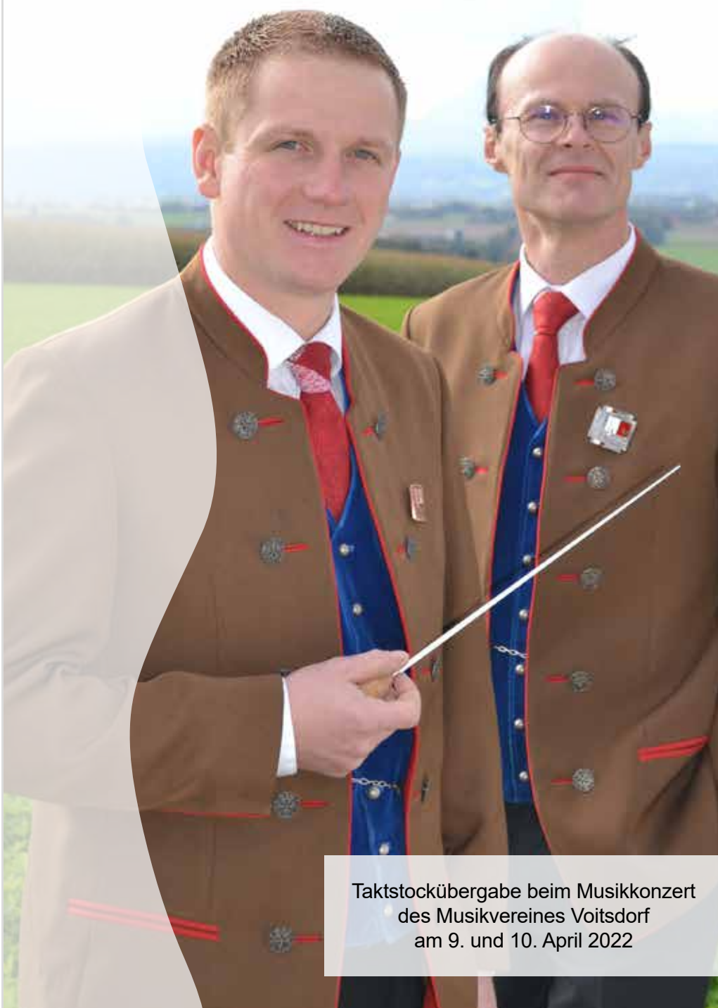
Taktstockübergabe beim Musikkonzert des Musikvereines Voitsdorf am 9. und 10. April 2022

GEMEINDE NACHRICHTEN AMTLICHE INFORMATIONZEITUNG DER GEMEINDE RIED IM TRAUNKREIS