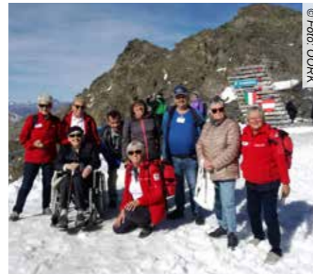
Mit einem Sicherheitsnetz im Gepäck geht es für die Teilnehmer der Betreuten Reisen auf Urlaub.

Alle Informationen beim Reisecafé Ein erfahrenes Team aus diplomiertem Pflegepersonal, Altenfachbetreuern und Rotkreuz-Mitarbeitern kümmert sich um die Urlauber während der gesamten Reise. Sie geben Sicherheit, fördern die Gemeinschaft und sorgen dafür, dass sich auch Alleinreisende niemals einsam fühlen. Das wissen viele Stammkunden zu schätzen.