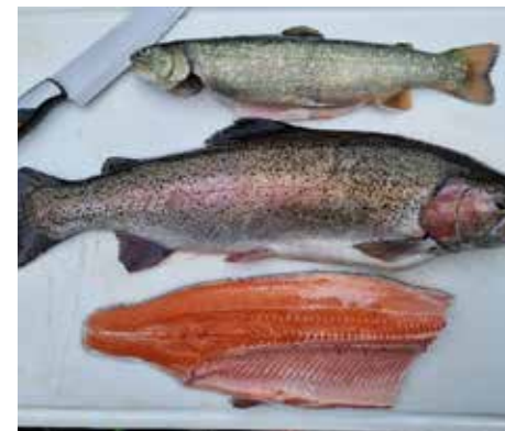
Urprodukt Lachsforelle, Regenbogenforelle und Saibling

Der Großteil meiner Fische sind Salmoniden, das heißt Regenbogenforellen, Saiblinge und Bachforellen.