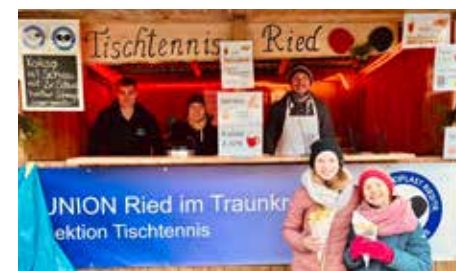
Weihnachtsmarkt am Dorfplatz

Verletzungen und krankheitsbedingte Ausfälle prägten die Herbstsaison 2022. Von acht Mannschaften liegen zur Saisonhalbezeit vier auf einem Abstiegsplatz - drei davon haben aktuell die rote Laterne umgehängt. Die anderen Teams liegen im gesicherten Mittelfeld auf den Rängen 5 - 7. Von 71