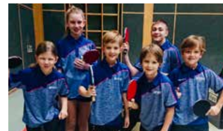
Beim RC Turnier in Vorchdorf

Spielen im Herbst konnten 17 (24%) gewonnen und in 6 (8%) ein Unentschieden errungen werden.