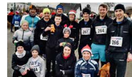
Krampuslauf in Ried