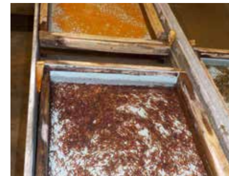
im Bruthaus vom Ei zum Brütlingen

Bei Interesse und Bestellungen kontaktieren Sie mich bitte unter Tel. 0664 / 9607446 oder g.salaboek@gmail.com .