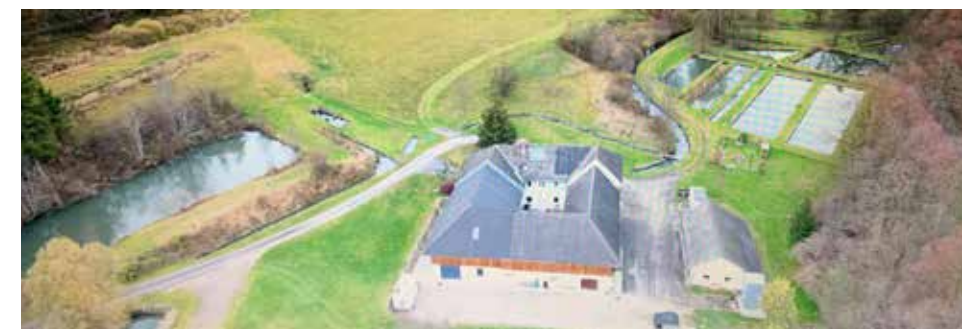
Fischzucht Mühlau von oben

Meine Fische werden im eigenen Bruthaus vom Ei zum Brütlingen herangezogen und später in Naturteiche ausgesetzt. Im Zeitraum von 1,5 Jahren bei Regenbogenforellen und 3 Jahren bei Bachforellen, wachsen diese zu Besatz und Speisefischen heran.