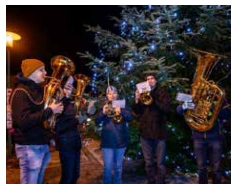
Musikalische Umrahmung beim Weihnachtsbaum aufstellen