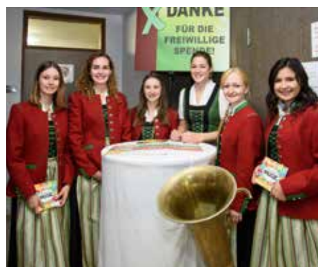
Marketenderinnen erstrahlen in neuer Tracht