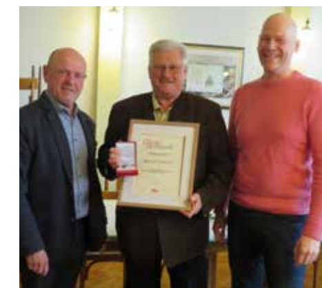
Ehrung des Ehrenvorsitzenden