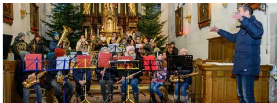
Der Andachtsjodler rundete den stimmungsvollen Nachmittag ab