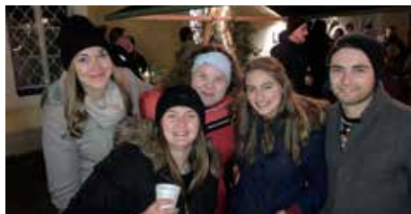
Punschstand nach der Christmette

bei Punsch und Glühmost mit uns die Weihnachtsnacht ausklingen haben lassen. (Eva Zaunmair)